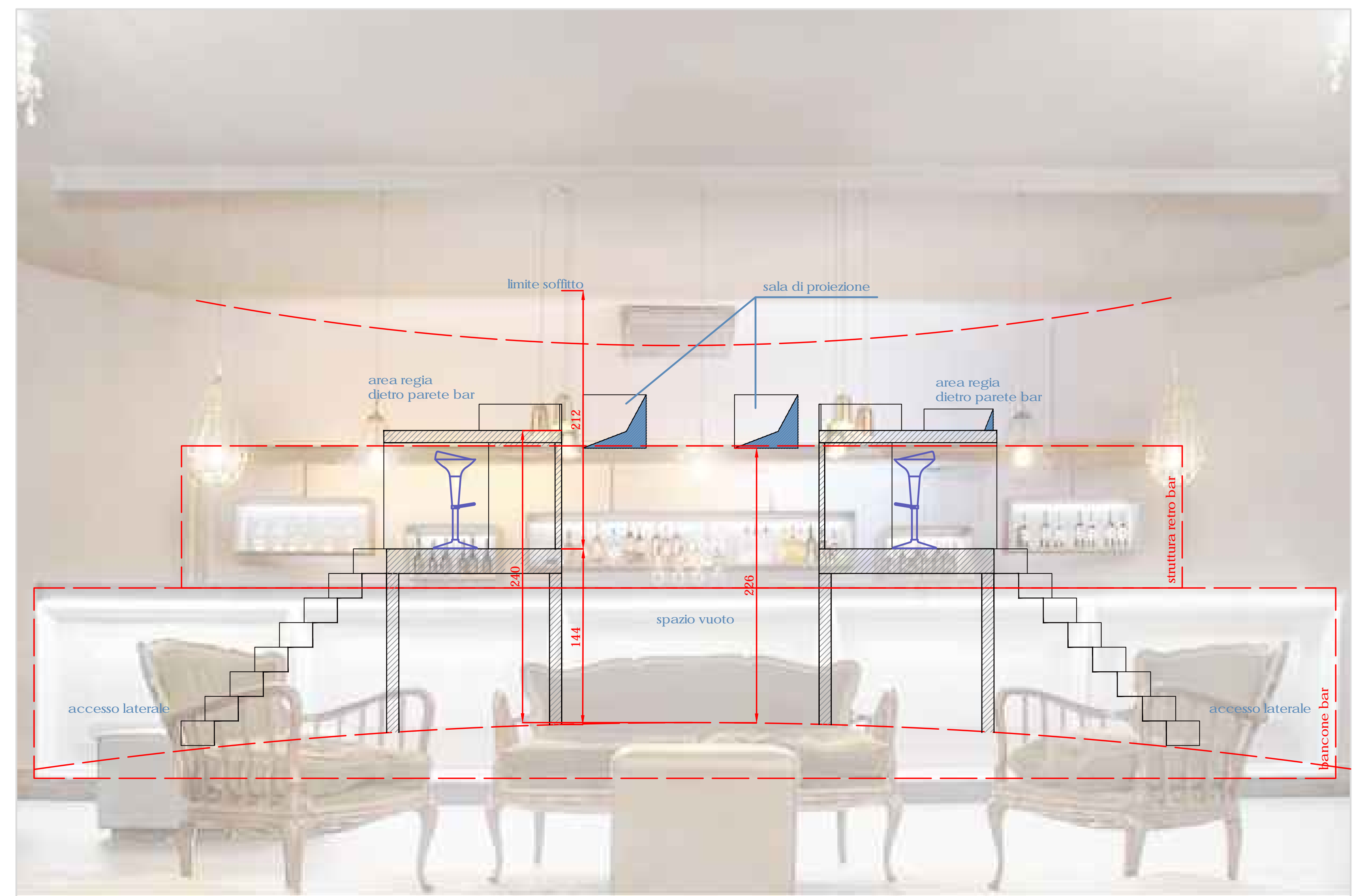
ZONA BAR - simulazione proposta nuova postazione consolle regia dietro area bar